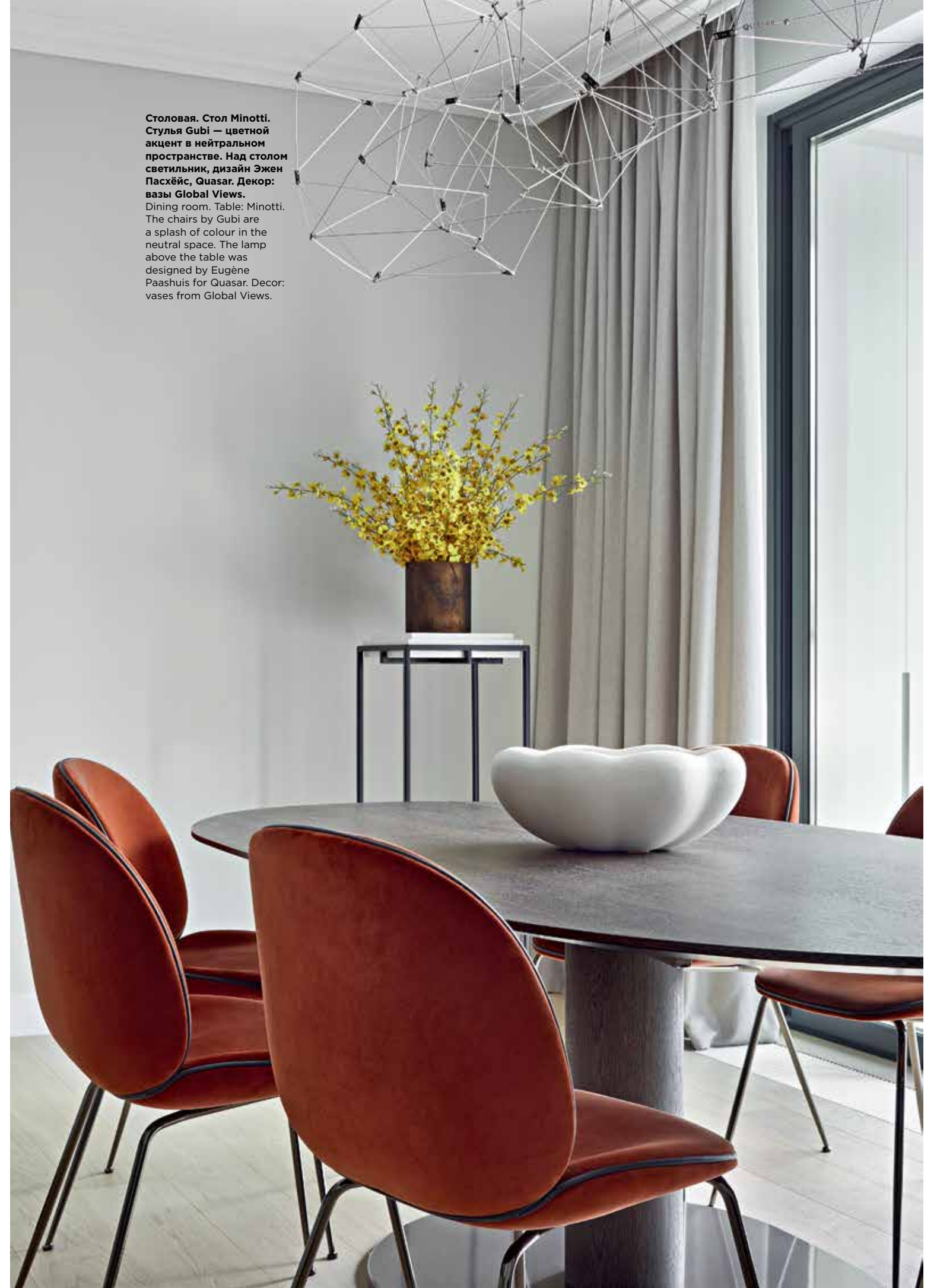
Столовая. Стол Minotti. Стулья Gubi — цветной акцент в нейтральном пространстве. Над столом светильник, дизайн Эжен Пасхэйс, Quasar. Декор: вазы Global Views. Dining room. Table: Minotti. The chairs by Gubi are a splash of colour in the neutral space. The lamp above the table was designed by Eugène Paashuis for Quasar. Decor: vases from Global Views.