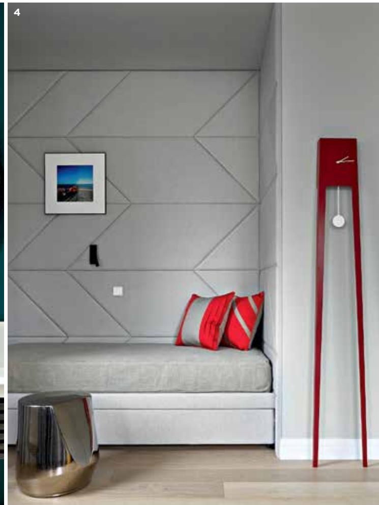
1. Холл. Геометрия потолочного карниза вторит дверным порталам. Двери Attribut. Бра Heathfield. 2. Хозяйская ванная. Раковина Toto. Смесители Dornbracht. Подвесная тумба выполнена на заказ в DM-Dekor. 3. Гостевой санузел. Раковина Toto. Смесители Dornbracht. Свет Egoluce. Тумба DM-Dekor. 4. Детская мальчиков. Часы Covo, L'appartement. Керамический пуф Pianca. Кровать и стеновые панели выполнены в компании My Atlant. Свет «Центрсвет».